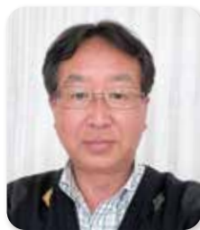
社会福祉法人シオンの丘 理事長 愛の園保育園・こひつじ保育園園長