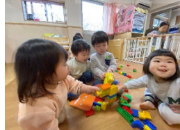
みんなと一緒に 「かんばーい！」