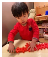
イメージした物 作れるように

※25日（土）は愛の園保育園の卒園式を行いますので、家庭保育のご協力をお願い致します。