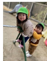
お友だちを助 けてあげる！