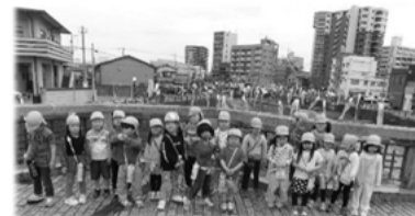
板櫃川へ、 こいのぼり 見学に… (5歳児)