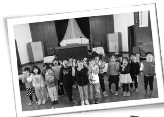
教会でイースターの たまご探しをしました！ (5歳児)